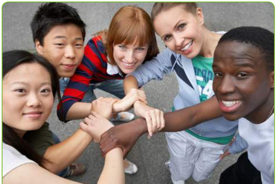
Grafik: © Bernhard Lutz, Geistlicher Leiter BDKJ Diözesanverband Würzburg

Unsere politischen und gesellschaftlichen Antworten auf diese Suche sind nach wie vor unzureichend. Das im Grundgesetz verankerte Recht auf Asyl und das in der Genfer Flüchtlingskonvention festgelegte Recht auf humanitären Schutz wird zunehmend in Frage gestellt. Gleichzeitig gibt es kaum Möglichkeiten zur legalen Einreise für Menschen, die auf der Suche nach Arbeit und Lebensunterhalt sind. Die Aussetzung der Familienzusammenführung für Geflüchtete aus Kriegs- und Krisengebieten mit subsidiärem Schutz widerspricht dem Gebot des Schutzes von Ehe und Familie.